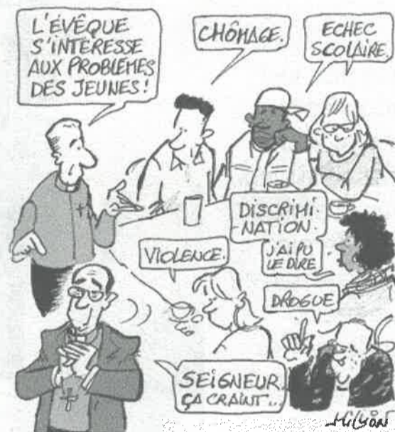
Cool, jusqu'au bout, nous avons soumis à l'évêque une série de caricatures. Ça l'a fait rire : il a choisi ce dessin.

« Un évêque peut-il s'exprimer sans tabou ? Tout dépend où on place le tabou. Mais quand il s'agit de foi chrétienne, on ne peut pas tout résumer en quelques mots. »