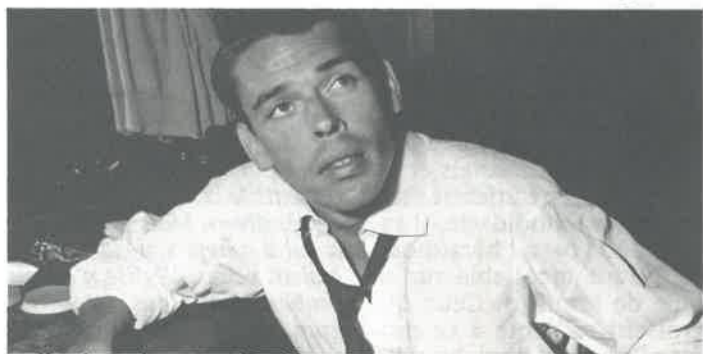
Il adore Jacques Brel !