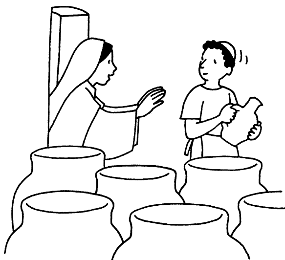
Les Noces de Cana