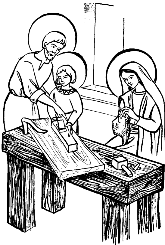
Image sans lien avec un stand.

Prévoir un jeu des 10 images pour chaque stand. (sans indiquer le titre correspondant !)