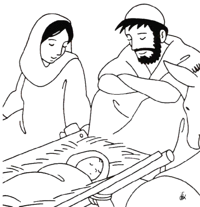
Noël la naissance de Jésus