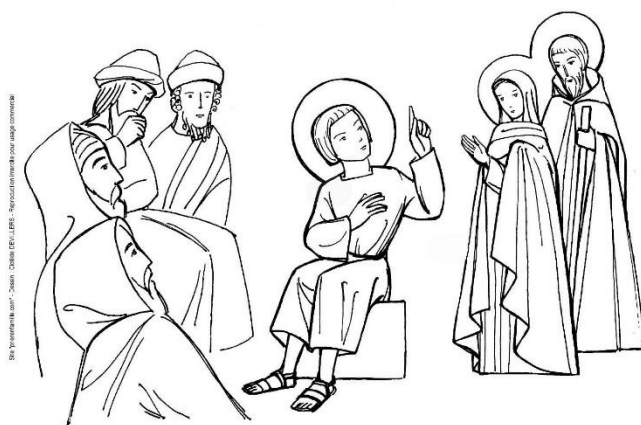
Jésus et les Docteurs de la Loi