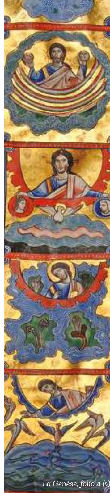
La Genèse, folio 4 (v)