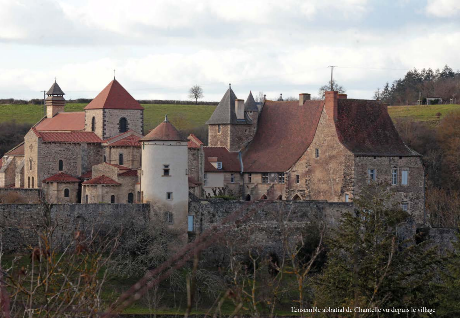
L'ensemble abbatial de Chantelle vu depuis le village