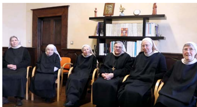
Les soeurs Bénédictines de l'Abbaye de Chantelle sont actuellement 8 (6 sur la photo), la doyenne a 101 ans !

ACCUEIL & COMMUNAUTE contact@benedictines-chantelle.com - 04 70 56 62 55 ATELIERS 04 70 56 62 69 www.benedictines-chantelle.fr