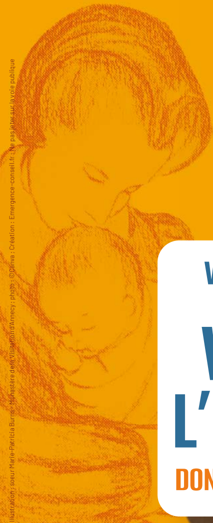
Illustration : sœur Marie-Patricia Burns - Monastère de la Visitation d'Amécy - photo : ©Géna - Création : Emergence-conseil.fr - Ne pas jeter sur la voie publique